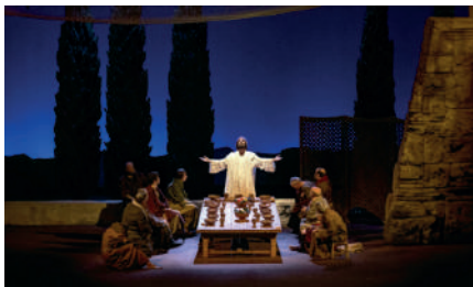
Fotografia de Joan Plans