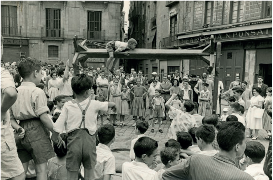
Cucanya de la Plaça Nova, durant les Festes de Sant Roc. 1955.

Sant Roc és venerat a la Plaça Nova des de l'any 1589, amb motiu d'haver preservat el barri del flagell de la pesta. Des d'aquesta data la devoció en aquest sector de la Barcelona antiga no s'ha interromput i cada any, el 16 d'agost, commemora la seva diada.